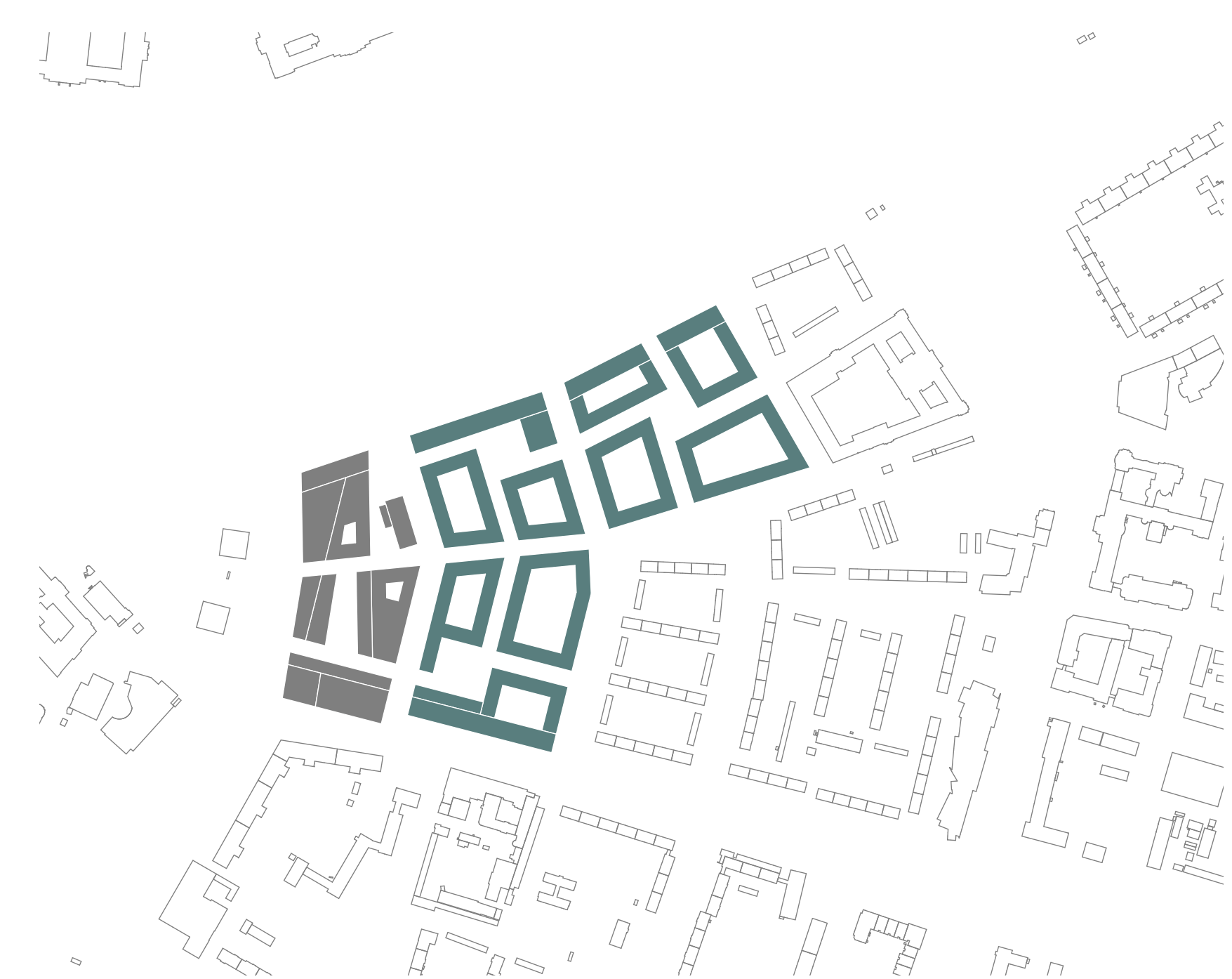
Bauphase II - 2030 - 1:500