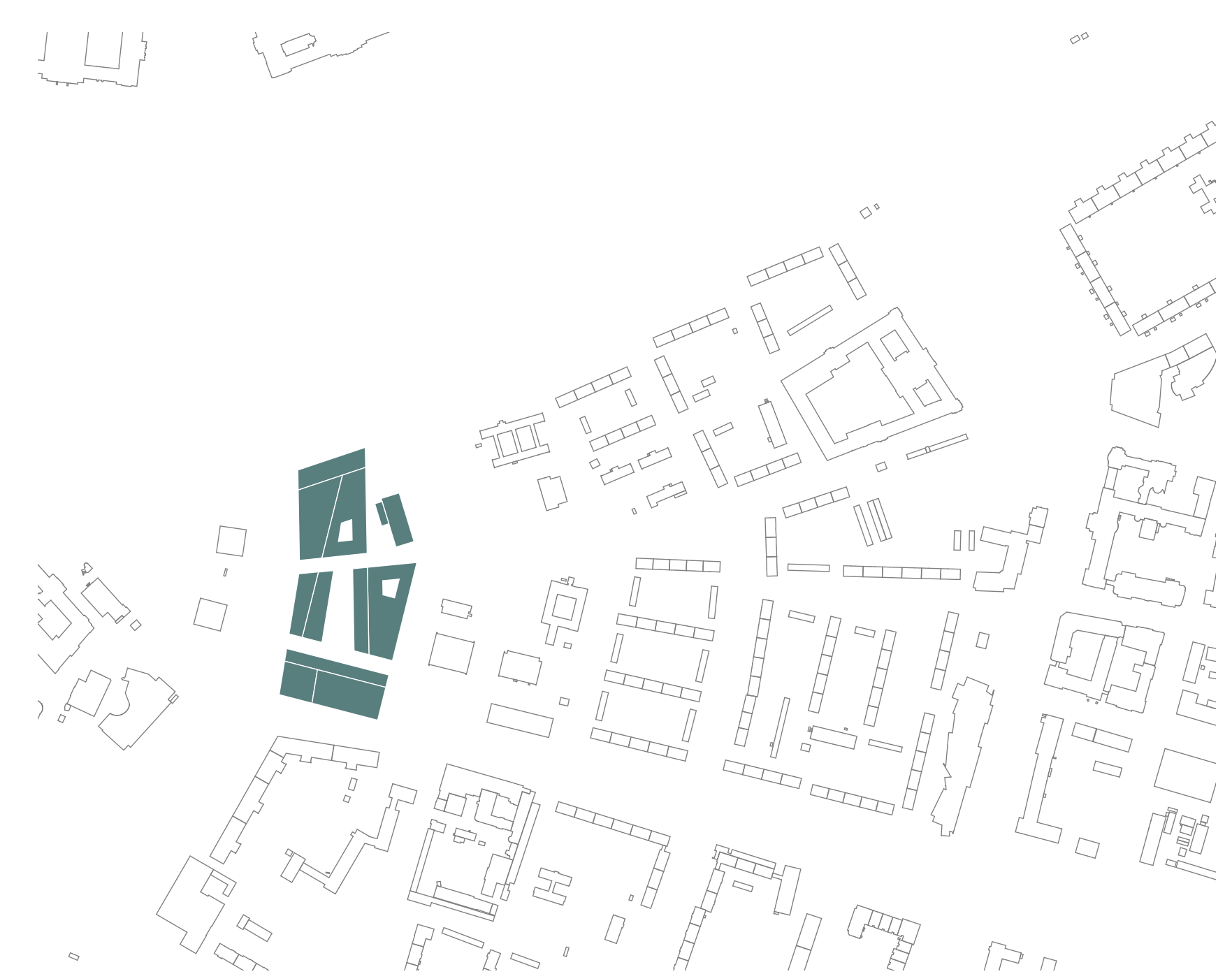
Bauphase I - 2020 - 1:500