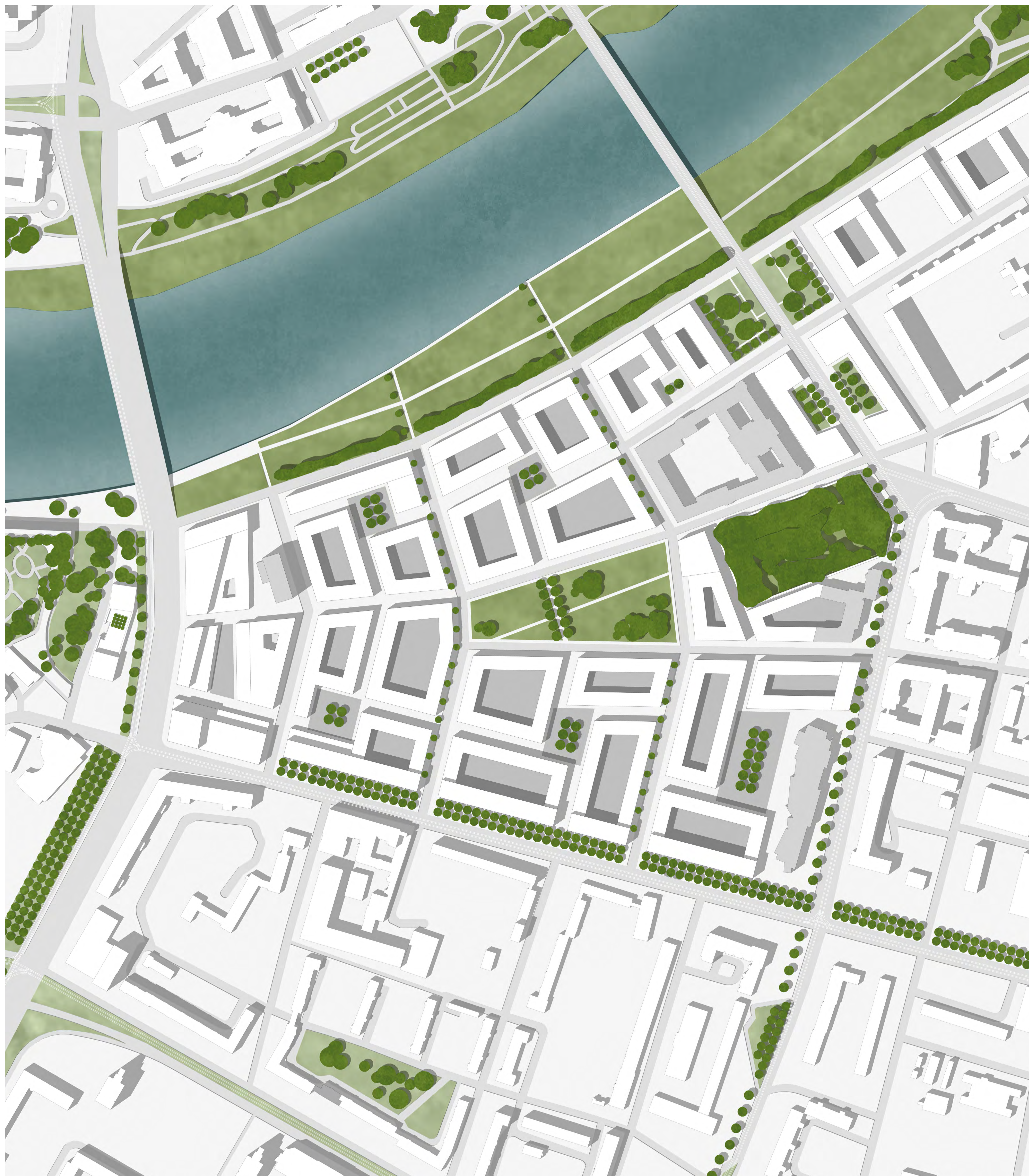
Konzeptplan - 1:2000