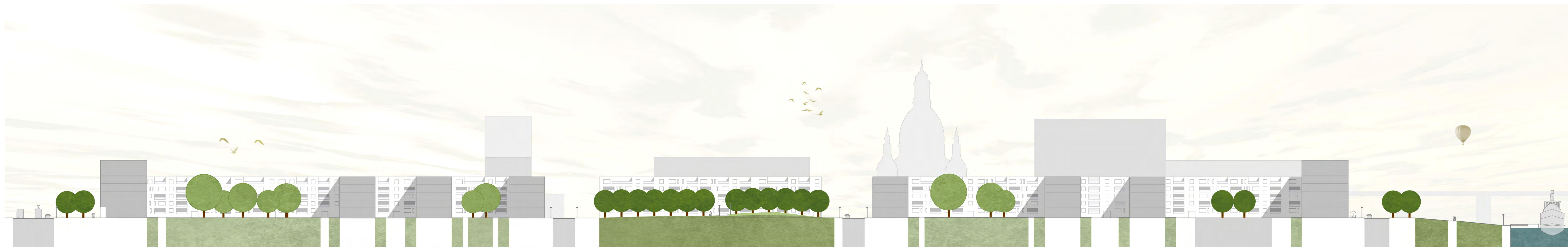
Detailschnitt - 1:500