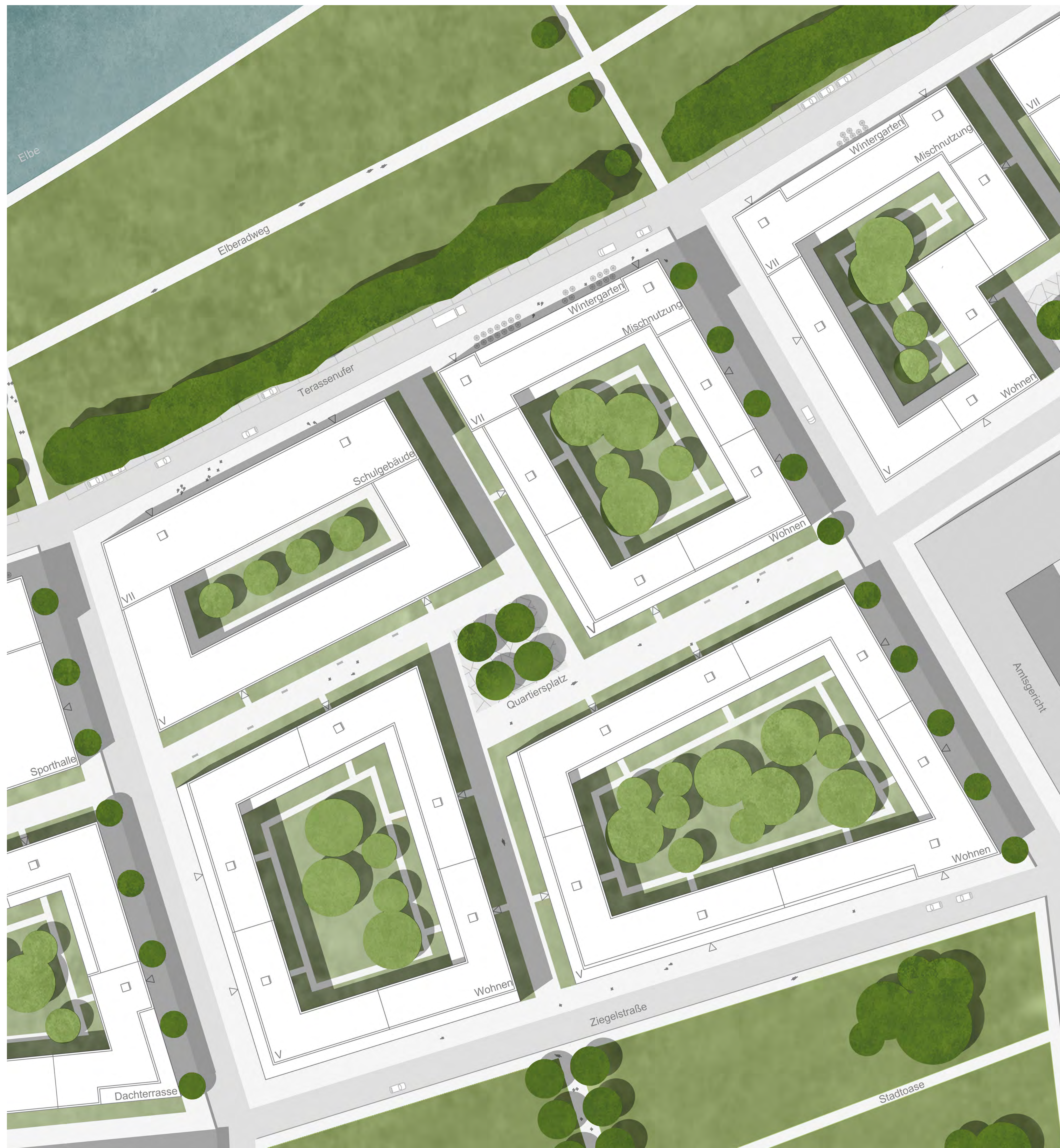
Detailplan - 1:500