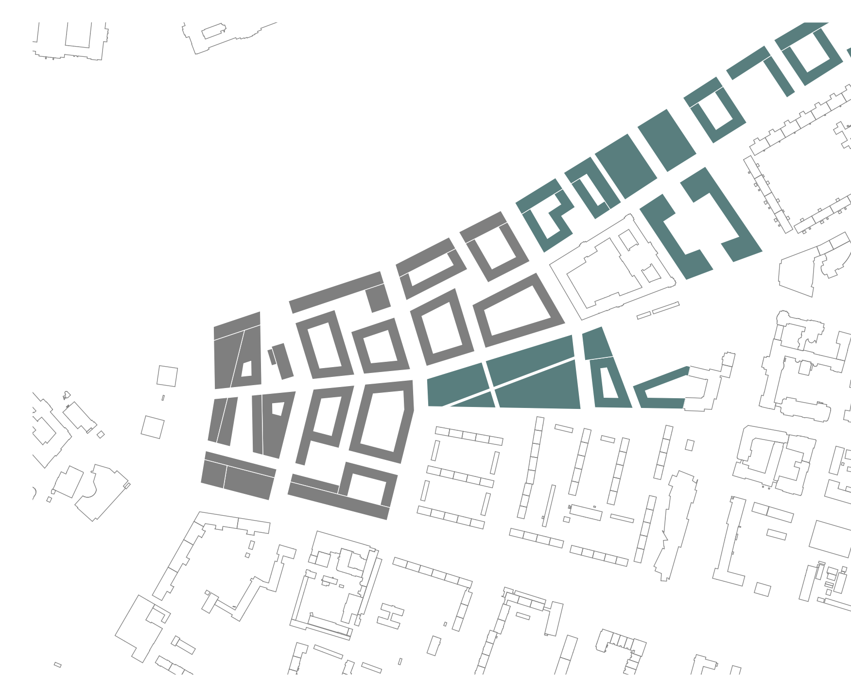
Bauphase III - 2040 - 1:500