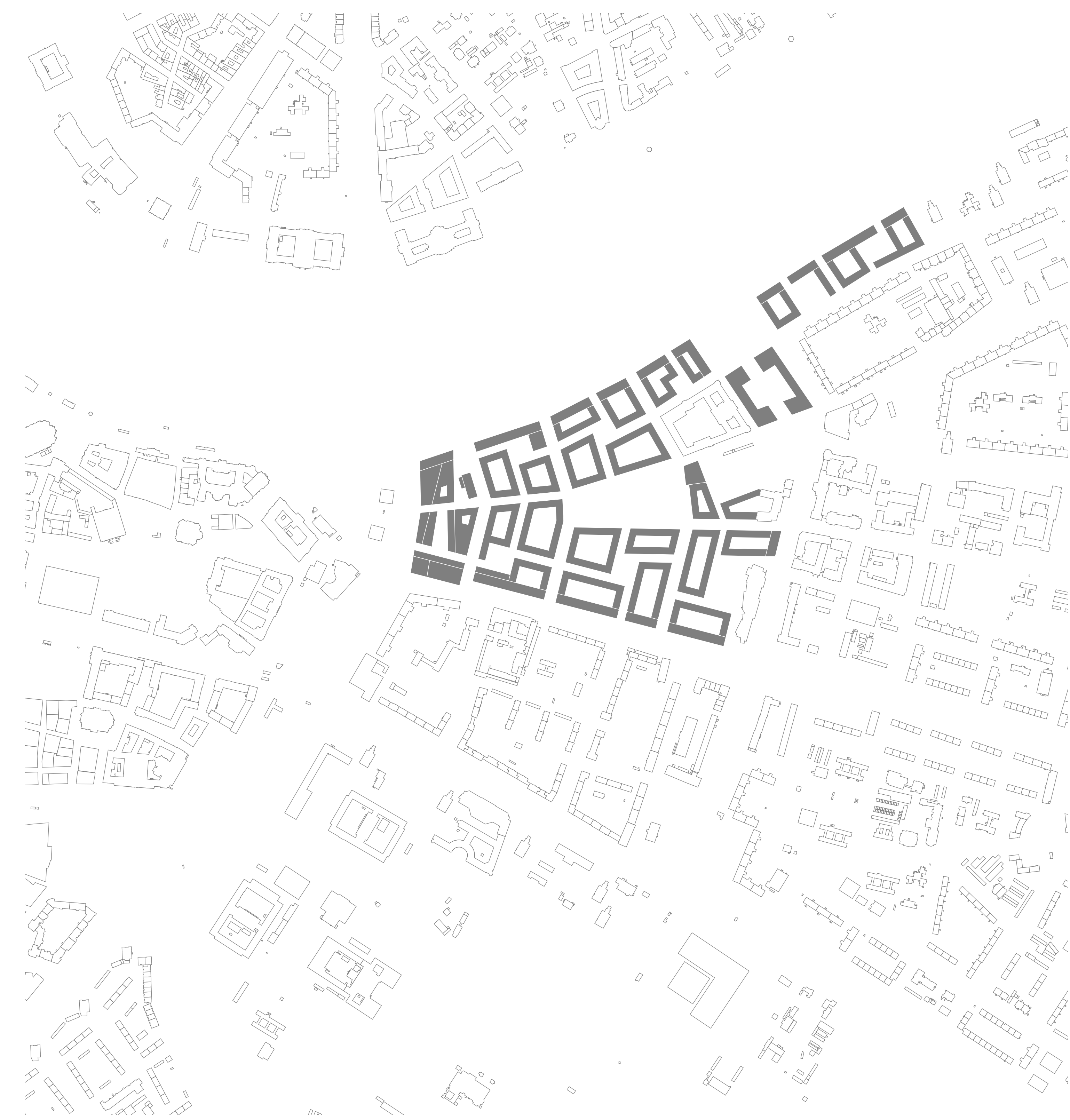
Schwarzplan - 1:5000