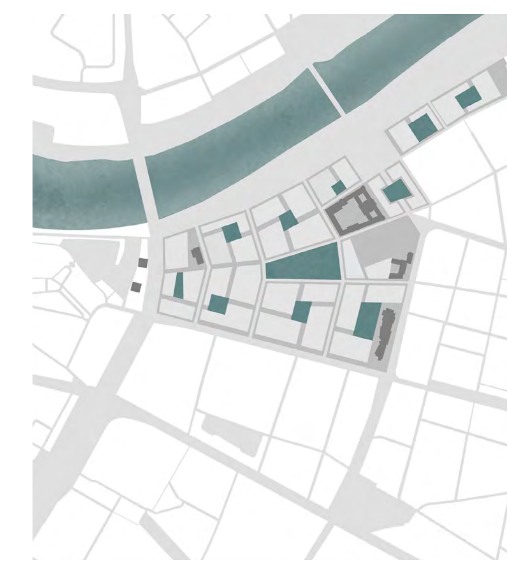
Zentrales Konzept: Bildung von vernetzten öffentlichen, halböffentlichen und privaten Freiräumen