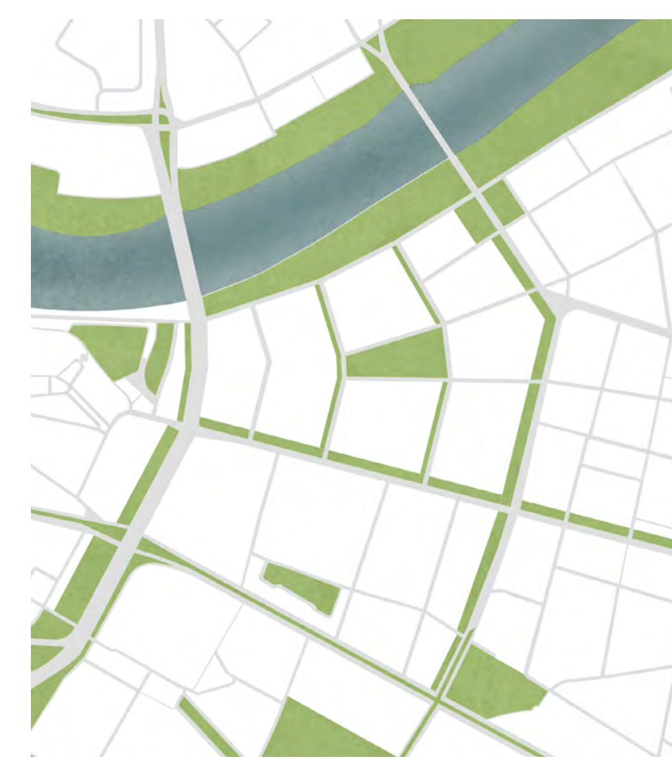
Verknüpfung des übergeordneten Grünraums