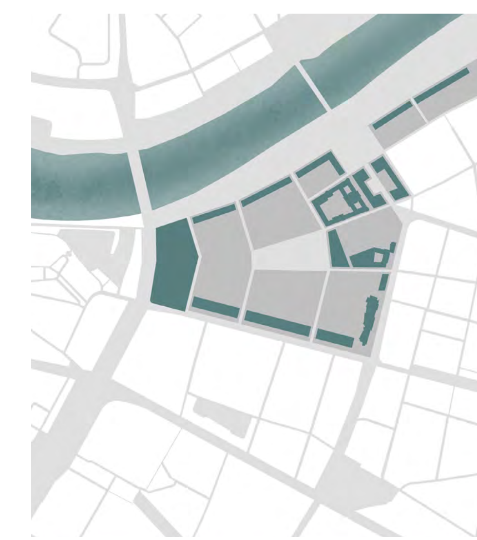
Ausbildung städtebaulich starker Kanten und Anbindung an Altstadt